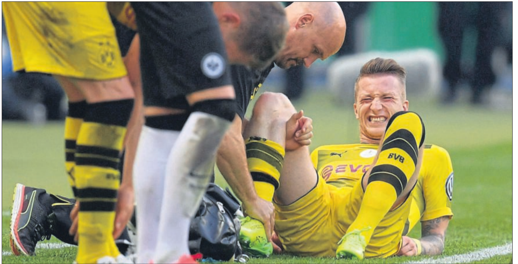
Einer der größten Pechvögel der Bundesliga: Laut des Internetportals www.fussballverletzungen.com hatte der Dortmunder Marco Reus (Foto) in den vergangenen acht Jahren 57 Verletzungen. Nur Sven Bender hat es mit 69 Ausfällen noch härter erwischt.